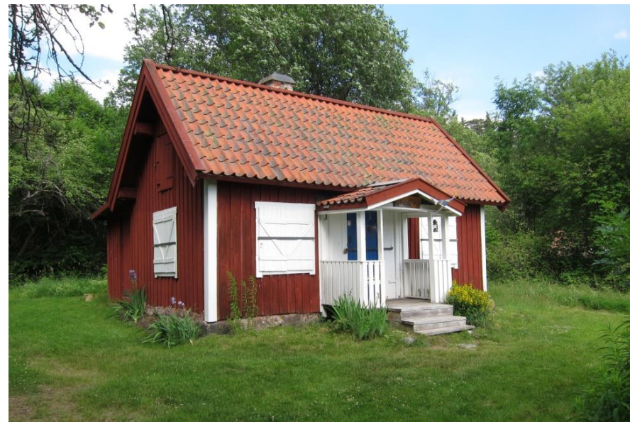
Gamla torpet i Sjöheden.

Ängen ovanför Kanaanbadet där Kanaans handelsträdgård låg. Nu finns bara några förvildade äppelträd kvar. Av husen syns endast några gamla stengrunder.