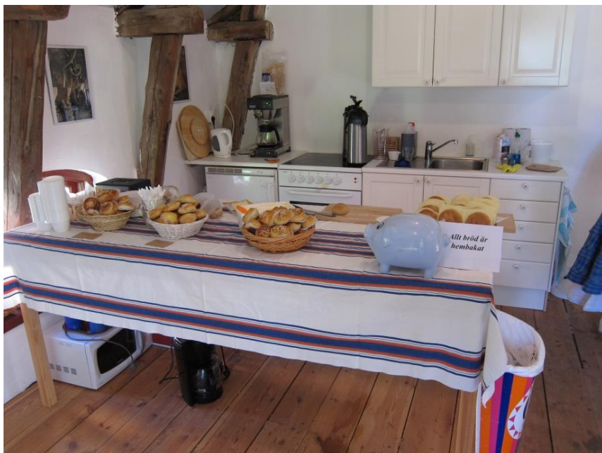
Bild från kaféet på kvarndagen den 26 maj. Allt bröd som serverades var hembakat på kvarnens eget mjöl.

I höst kommer vi att ha 2 kvarndagar, 1 och 15 september. Öppet hus kl 11-16. Som vanligt blir det försäljning av nymalet ekologiskt mjöl och kaffeservering.