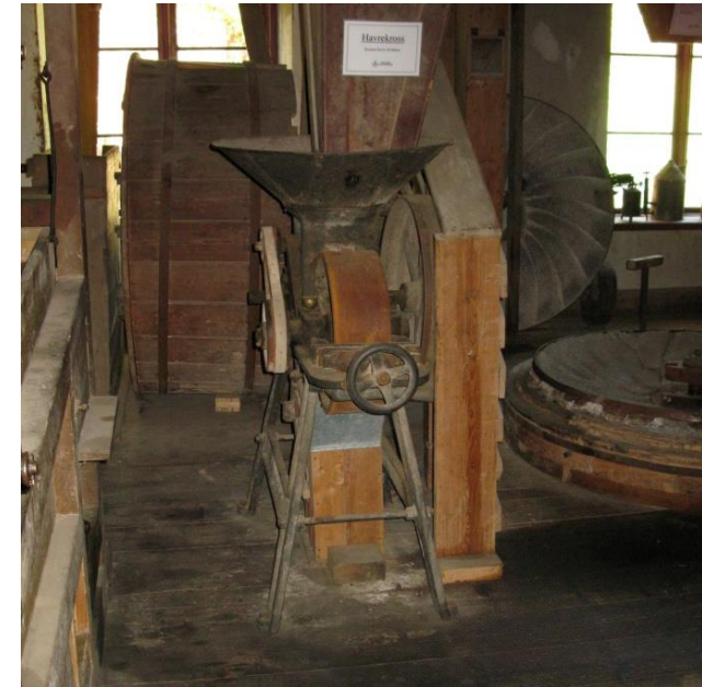
Havrekrossen i kvarnen