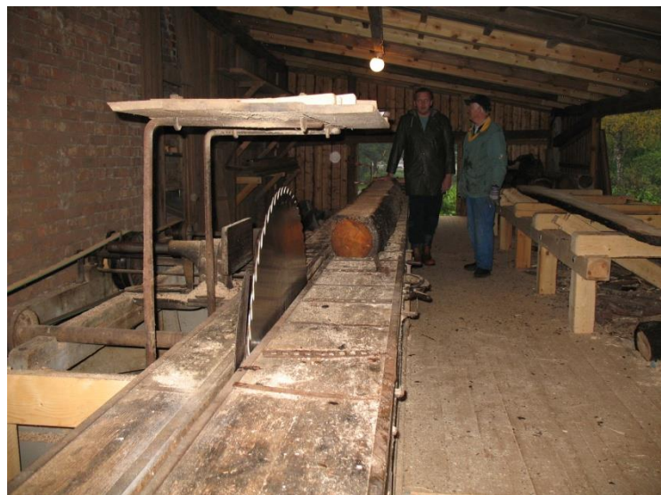
Sågning i sågen oktober 2006